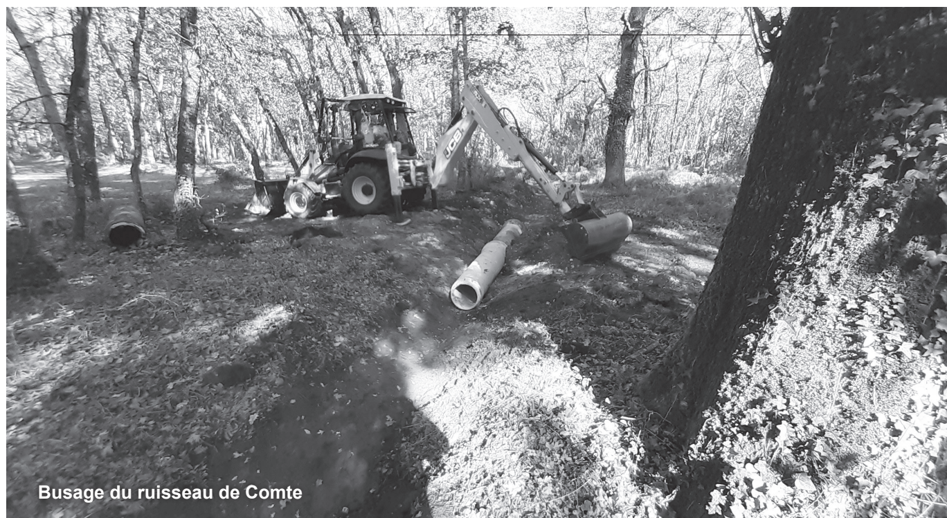
Busage du ruisseau de Comte

Solde disponible au 31/12/2021 24567,27 €