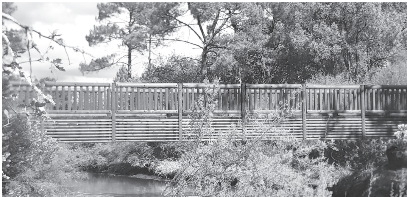
Passerelle du Cirès